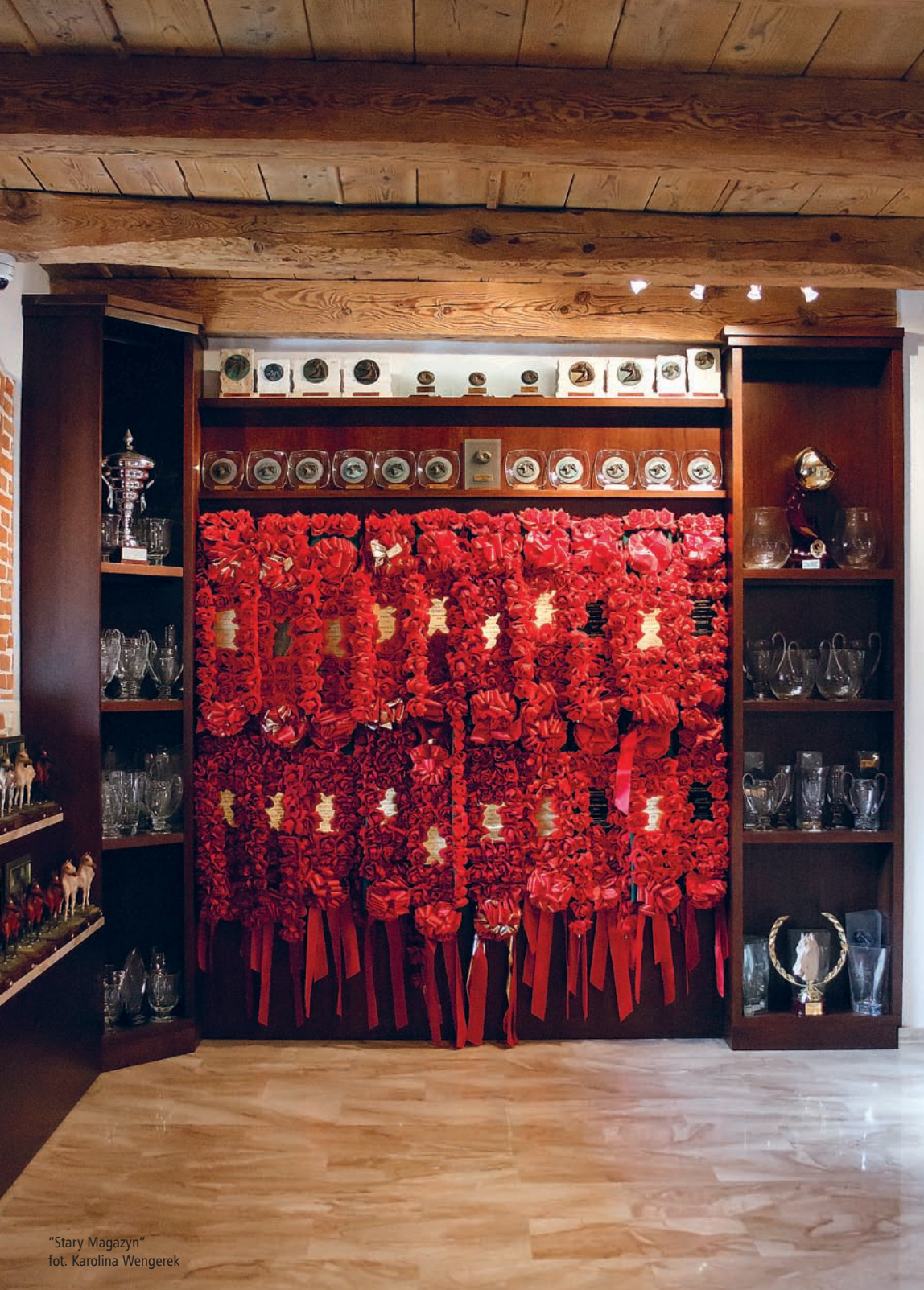
"Stary Magazyn"